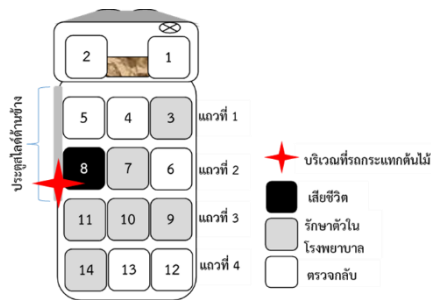
ภาพ 2 ตำแหน่งที่นั่งรถตู้ประจำทาง

2.1.4 ข้อมูลและลักษณะการบาดเจ็บและเสียชีวิต ผู้ประสบเหตุ จำนวนทั้งหมด 15 ราย ประกอบด้วยผู้ขับขี่รถกระบะ จำนวน 1 ราย รถตู้ประจำทาง จำนวน 14 ราย (ผู้ขับขี่ จำนวน 1 ราย และผู้โดยสาร จำนวน 13 ราย) ผู้บาดเจ็บทั้งหมดอยู่ในรถตู้ประจำทาง (เสียชีวิต ณ จุดเกิดเหตุ จำนวน 1 ราย รักษาตัวในโรงพยาบาล จำนวน 6 ราย) อัตราการบาดเจ็บร้อยละ 93.3 อัตราการเสียชีวิตร้อยละ 6.7 ส่วนใหญ่เพศชาย จำนวน 8 ราย (ร้อยละ 57.1) เพศหญิง จำนวน 6 ราย (ร้อยละ 42.9) อายุระหว่าง 19-80 ปี อายุเฉลี่ย 43 ปี ความรุนแรงของการบาดเจ็บ ส่วนใหญ่บาดเจ็บที่ไม่ต้องนอนพักรักษาตัวในโรงพยาบาล (จำหน่าย) จำนวน 8 ราย (ร้อยละ 57.2) รับไว้รักษาตัวในโรงพยาบาล จำนวน 5 ราย (ร้อยละ 35.7) เสียชีวิต จำนวน 1 ราย (ร้อยละ 7.1)