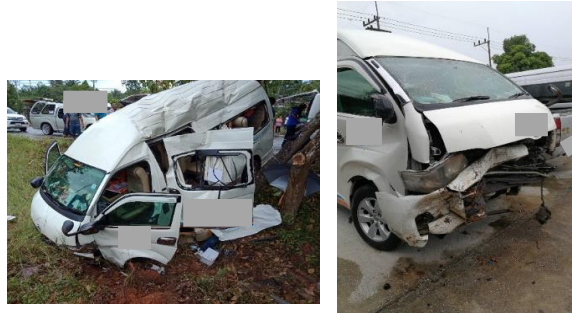
ภาพ 6 สภาพรถตู้โดยสารประจำทางหลังเกิดอุบัติเหตุ

75 กิโลเมตร/ชั่วโมง สภาพรถหลังเกิดเหตุกันชนหน้าพังเสียหายถึงห้องเครื่อง ประตูด้านซ้ายโดยสารด้านหน้ายุบ ประตูสไลด์ด้านข้างยุบเปิดออก หลังคารถบุบ (ภาพ 6)