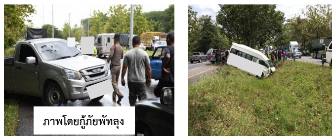
ภาพ 1 สภาพหลังชนของรถกระบะบรรทุกและผู้โดยสารประจำทาง

1.1 ภาพรวมการเกิดอุบัติเหตุ ช่วงเที่ยงของวันฝนเริ่มเบาบางหลังจากตกลงมาอย่างหนักระยะหนึ่ง รถกระบะที่กำลังวิ่งบนช่องทางเดินรถด้านซ้าย เสียหลักเบี่ยงเข้ามาในช่องทางเดินรถด้านขวา ซึ่งรถตู้โดยสารประจำทางกำลังวิ่งแซงขึ้นมาด้วยความเร็ว 75 กิโลเมตร/ชั่วโมง ทำให้บริเวณส่วนหน้าขวาของรถกระบะชนกับส่วนหน้าด้านข้างของรถตู้โดยสารประจำทาง ทำให้รถตู้โดยสารประจำทางพุ่งไปด้านขวาของถนนชนต้นไม้ในร่องกลางถนน ส่วนรถกระบะหมุนมาจอดบริเวณไหล่ทางช่องเดินรถด้านซ้าย ส่งผลให้ผู้ขับขี่และผู้โดยสารในรถตู้โดยสารประจำทางบาดเจ็บ จำนวนทั้งหมด 14 ราย เสียชีวิต 1 ราย จุดเกิดเหตุ จำนวน 1 ราย (ภาพ 1)