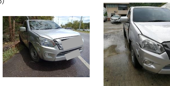
ภาพ 5 สภาพรถกระบะบรรทุกหลังเกิดอุบัติเหตุ

2.3.1 รถกระบะบรรทุก (ไม่มีหลังคา) สีเทา รุ่นปี ค.ศ.2016 เครื่องยนต์ 4 สูบ 2999 ซีซี 177 แรงม้า วันสิ้นอายุภาษี ปี พ.ศ.2562 ตรวจสภาพรถครั้งล่าสุดเดือนพฤษภาคม 2560 มีการทำประกันภัยภาคบังคับตาม พ.ร.บ. และประกันภัยภาคสมัครใจ สภาพรถหลังเกิดเหตุ มีรอยถลอกและรอยแตกบริเวณบังโคลนและกันชนหน้าขวา (ภาพ 5)