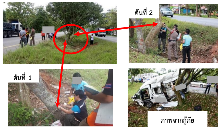
ภาพ 4 ต้นไม้บริเวณร่องกลางถนน

สภาพหลังเกิดเหตุ ช่วงเวลาเที่ยงสภาพแสงสว่างบนถนนปกติ พื้นถนนเปียกมีน้ำขัง มีรอยล้อรถวิ่งออกจากไหล่ทางไปร่องกลางถนนระยะทาง 19.3 เมตร ระยะทางจากเส้นไหล่ทางถึงต้นไม้ 3.3 เมตร ร่องกลางถนนกว้าง 7.5 เมตร ในร่องกลางถนนพบต้นไม้ที่มีร่องรอยการถูกชนจำนวน 2 ต้นที่อยู่ใกล้กัน ต้นไม้ต้นที่ 1 มีเส้นรอบวงบริเวณที่มีร่องรอยการชน 73 เซนติเมตร (เส้นผ่าศูนย์กลาง 11.6 เซนติเมตร) ต้นไม้ต้นที่ 2 มีเส้นรอบวงบริเวณที่มีร่องรอยการชน 94 เซนติเมตร (เส้นผ่าศูนย์กลาง 15.0 เซนติเมตร) มีความลาดเอียงของร่อง 3:1 (ภาพ 4)